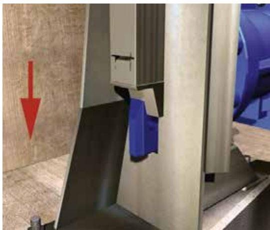
Bloqueo (vista interior)